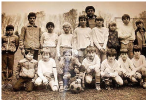
Pohled do minulosti