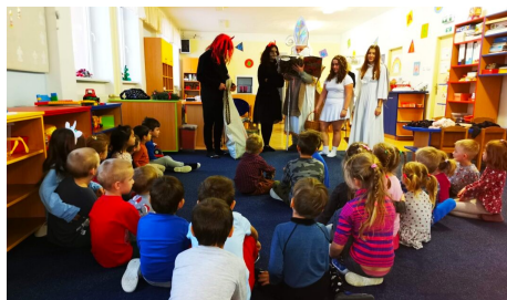
Text a foto str. 13: ZŠ a MŠ Jindřichov