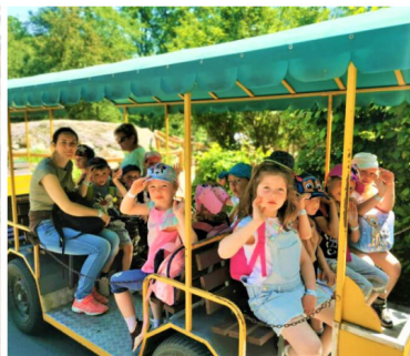
Text a foto str. 12: ŽŠ a MŠ Jindřichov